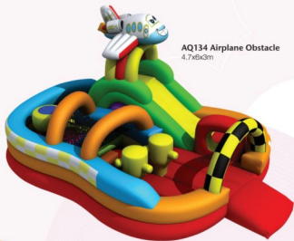
AQ134 Airplane Obstacle 4.7x6x3m