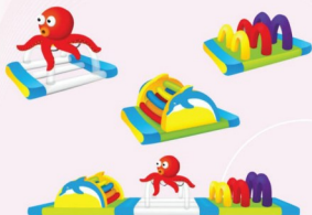
AQ3105 Water Park 8.1x1.8m