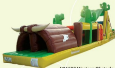
AQ1502 Western Obstacle 15.8x3x4.57m