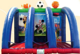
AQ1816 Bowl Game 4.4x5.7x4.2m