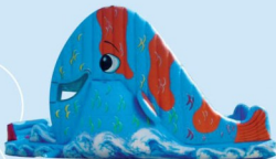
AQ993 Fish Slide 7.5x4x5m