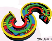
AQ124 Race Track 10.8x6.5x2m