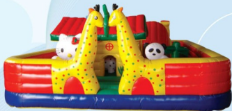
AQ1458 Fun Zoo 12x7x2.7m