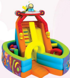
AQ118 Space Obstacle 6x7x5.5m