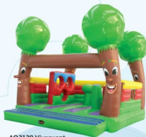
AQ2129 Vivecuent 5x5m