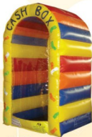
AQ1607 1.5m x 1.8 x 3m