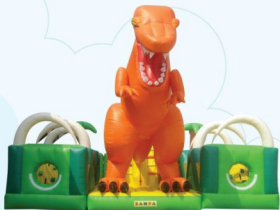
AQ1328-1 Dinosaur Fun City 8x9x5m