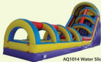
AQ1014 Water Slide & Slip 5.5x16x4.5m