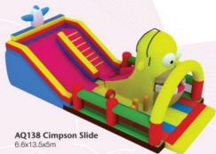
AQ138 Simpson Slide 6.6x13.5x5m