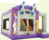
AQ703 Batman Combo 5x5x5m