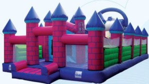
AQ1305 Fun Castle 6x8m