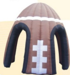
AQ5242 Baseball Tent ø3mx3mH door:1.8mH