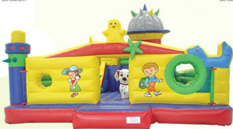
AQ1463 Kid Playland