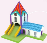
AQ131 Church & Slide 7x6x8m