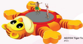
AQ3104 Tiger Trampoline Ø4m