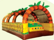
AQ1442 Jungle Obstacle 8x6x3m