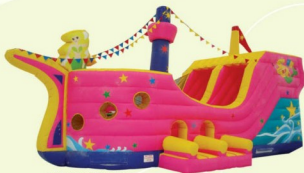
AQ1503 Pirate Boat 10x5x5m