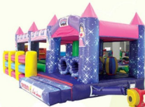
AQ1410 Princess Castle Obstacle 10x4x2.8m