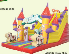
AQ9102 Horse Slide 5x9x6.5m