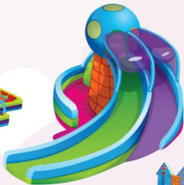
AQ120 *6* Slide 14x10x8m