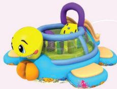
AQ119 Turtle Combo 6.5x5x3.5m