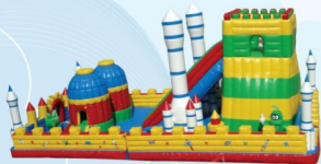
AQ1301 Fun Rocketdrome 16x9x7m