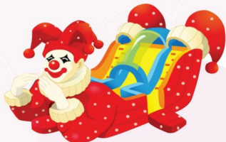
AQ121 Clown Back 14x6x8m